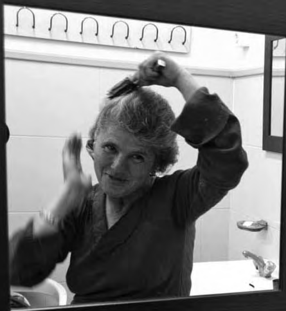
La María es pentina a la sala de dutxes del Centre Obert.