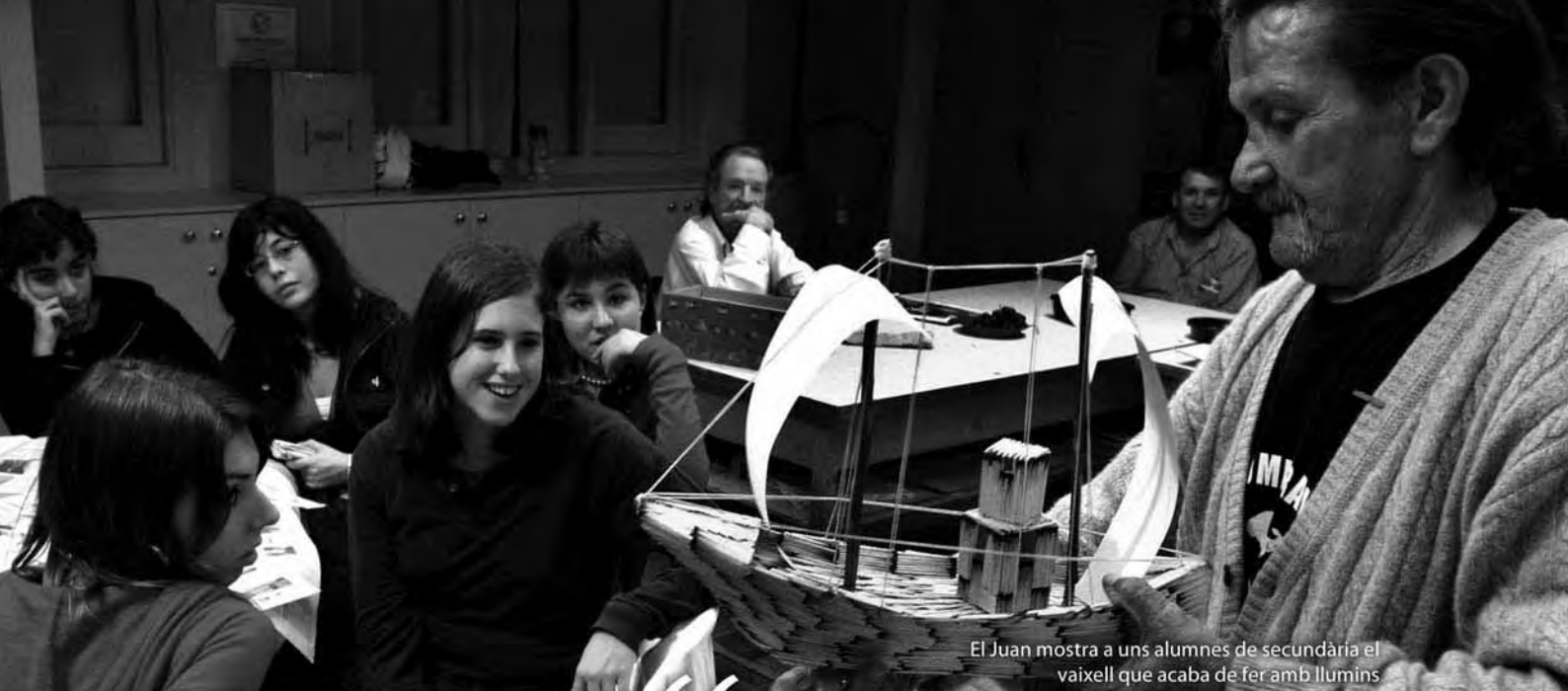
El Juan mostra a uns alumnes de secundària el vaixell que acaba de fer amb llumins