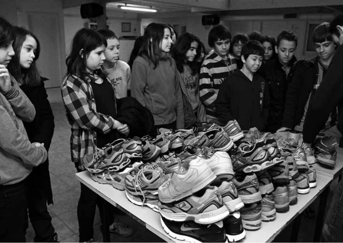
Els alumnes de sisè de l'escola Patronat Domènech visiten el rober d'Arrels.

Volem una societat madura i compromesa amb les problemàtiques socials, i és per això que dediquem temps i esforços per apropar-nos als ciutadans més joves, per tal d'explicar-los els perquè de la gent que dorm al carrer i trencar tòpics. Si els joves coneixen la realitat de les persones que pateixen situacions d'exclusió, la seva visió d'adults serà molt més amable i podrem construir una societat molt més rica i justa.