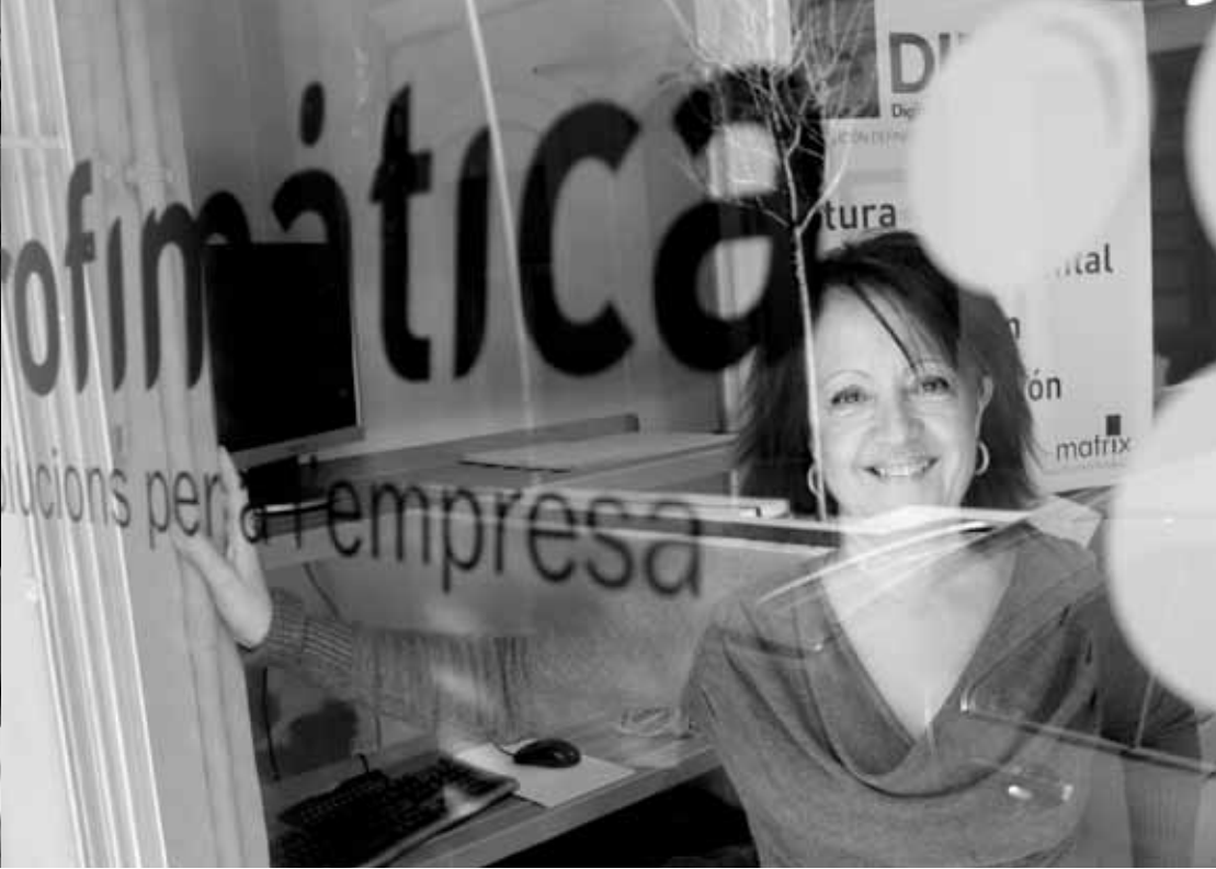
La Mari Carmen, de Profimàtica, col·labora activament amb Arrels Fundació.

En una conjuntura econòmica i social com l'actual, destaquem la quantitat d'iniciatives i propostes que hem rebut enguany de persones i col·lectius que, més que mai, han volgut ser útils : grups que s'han ofert a organitzar espectacles d'art gratuïtament i que han fet possible establir vincles entre persones d'àmbits diferents; artistes que han volgut promoure productes realitzats a Arrels, periodistes que s'interessen pel present de les persones acompanyades, i pel futur dels homes i dones que actualment comencen a trobar-se en situacions molt difícils, etc.